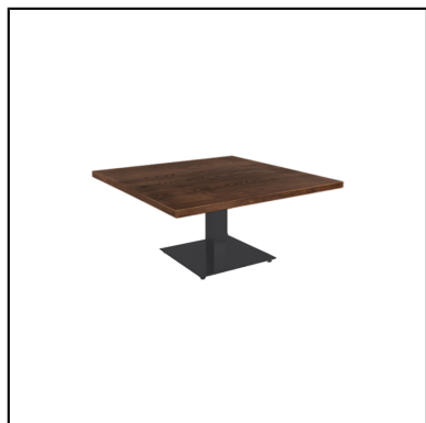
Table basse Stan H35 90x90 - bois & noir

Livré en kit avec son set de fixation pour plateaux de tables. Montage facile.