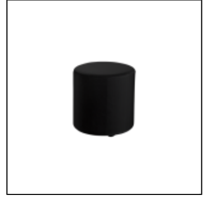
Pouf POP rond dia40 - noir