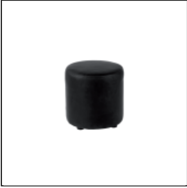
Pouf rond Dalton dia40 - cuir noir