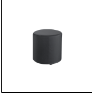
Pouf POP rond dia40 - gris